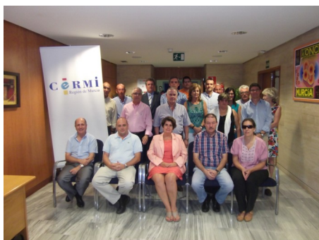
Nueva Junta Directiva del CERMI Región de Murcia

Según la Estrategia en Salud Mental, entre el 2'5 y el 3% de la población adulta tiene una enfermedad mental crónica. Esto supone más de un millón de personas