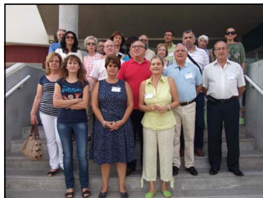
Participantes en la formación, acompañados por el alcalde de Molina de Segura, a las puertas del Centro de Día de AFESMO.

Los cambios producidos por la necesidad de ajustar los Centros y servicios a las exigencias de la Ley de Dependencia y el interés de nuestras Asociaciones por seguir mejorando y creciendo, han impulsado a FEAFES a organizar unas sesiones de formación e información que han contado con una alta participación.